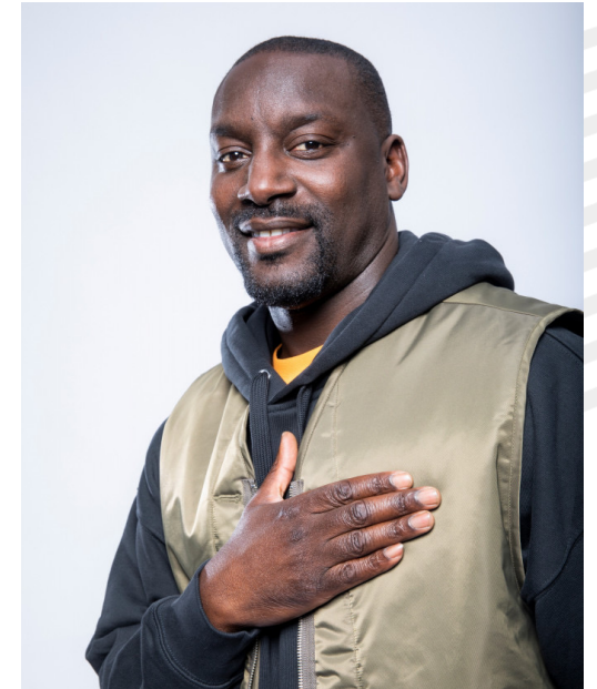
LADJI DOUCOURÉ ATHLETISME - Mentor

2 x Champion du Monde 2 x Champion d'Europe Indoor 8 x Champion de France 3 x Jeux Olympiques Co-Fondateur de Golden Blocks