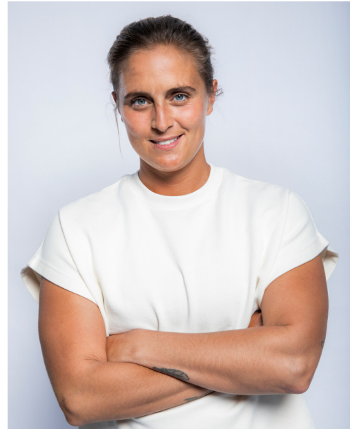
PAULINE DEROUÛÈDE TENNIS FAUTEUIL

2 x Champion du Monde 3 x Jeux Olympiques Médaille de Bronze Tokyo 2021 (Relais)