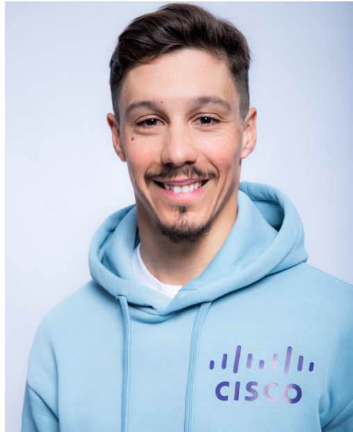
VINCENT LUIS TRIATHLON

2 x Champion du Monde 3 x Jeux Olympiques Médaille de Bronze Tokyo 2021 (Relais)